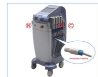
Lipolaser FG 660H-001 Multipads (Behandlungsplatten)